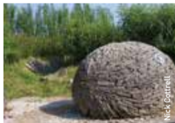
Drysa nyth yr alarch

Dinas llygoden y dŵr a drysfa nyth yr alarch – llefydd hyfryd i chwarae.