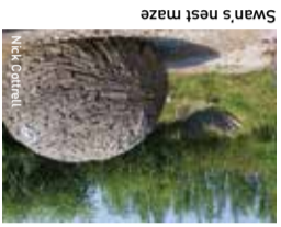
Swan's nest maze