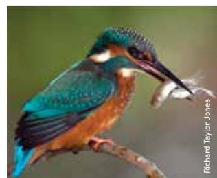
Glas y dorlan

Gweithgareddau crefft ac eraill drwy'r dydd ar benwythnosau ac yn ystod y gwyliau. Edrychwch ar y bwrdd hysbysebion.