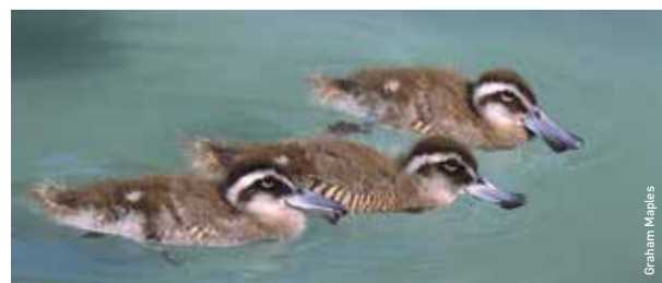
Cwion hwyaid clustiau pinc

Y Ganolfan: 9.30yb tan 5yh bob dydd. Tiroedd ar agor tan 6yh yn ystod yr haf. Ar gau ar Noswyl y Nadolig a dydd Nadolig. Caffé: 9.30yb tan 4.30yh. Prydau bwyd twm rhwng 12.00 a 2.30yh.