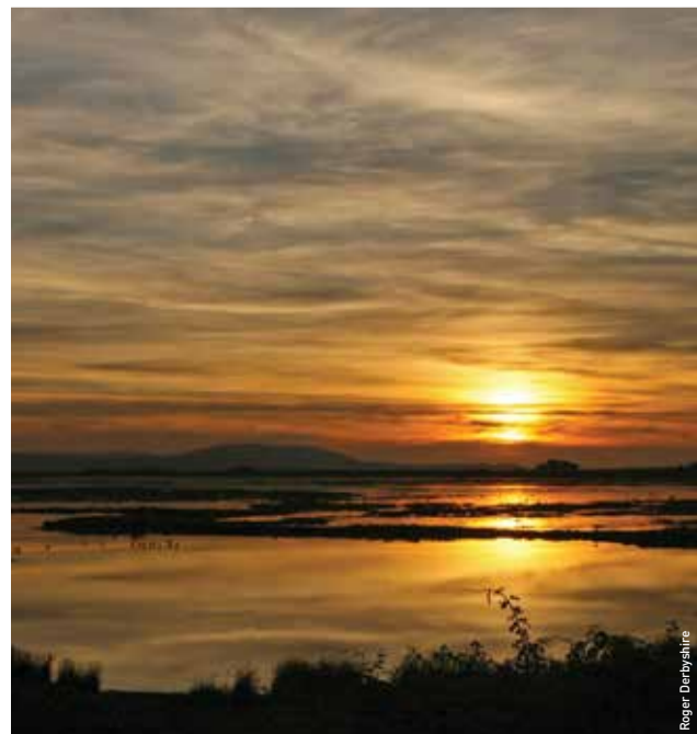
Cilfach Lluchwr fin nos

Bwydwch yr adar o'ch dwylo – gallwch brynu pecynnau o hadau wrth y ddesg wybodaeth.