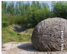
Drysfa nyth yr alarch