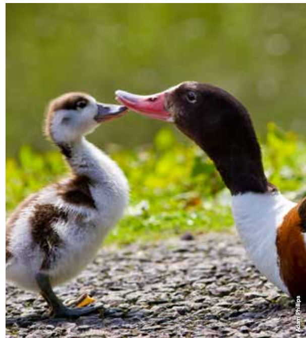
Hwyaden yr Eithin

WWT elusen gofrestrdig yn Lloegr a Chymru, rhif 1030884; yn yr Alban rhif SC039410