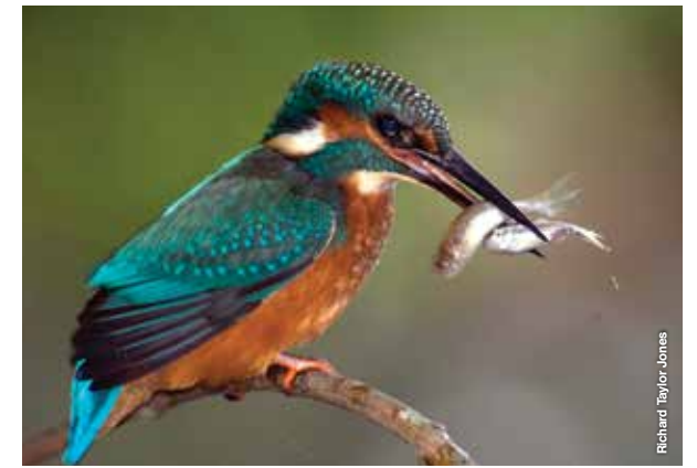
Glas y dorlan